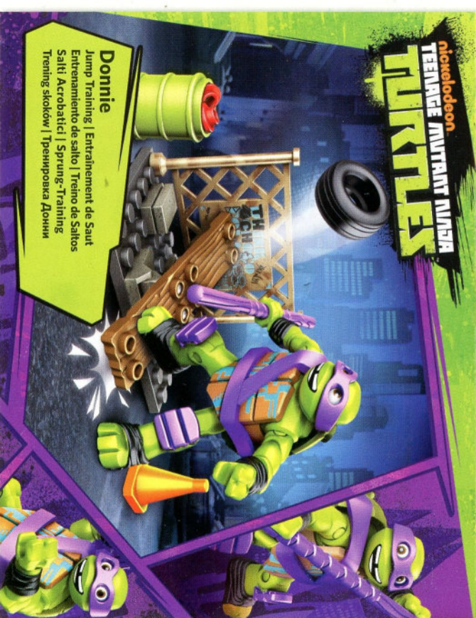
Donnie Jump Training | Entraînement de Saut Entrenamiento de salto | Sprung-Training Salti Arcoabridat | Тренінг-Тренінг Тренінг-Тренінг | Тренінг-Тренінг Донни